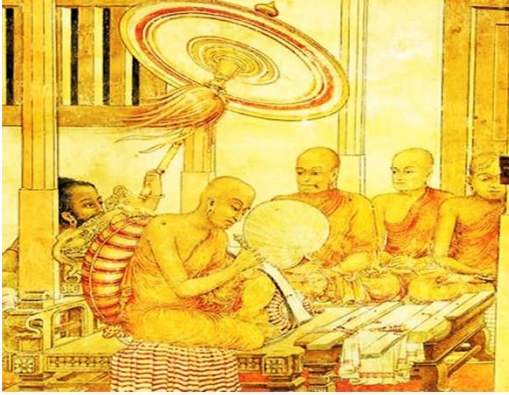
ඡායාරූපය 02 - මුල්ම ඓතිහාසික තොරතුරු සම්පාදනයන්

ආර්. ඒ. එල්. එච්. ගුණවර්ධනයන්ගේ අදහස වන්නේ විහාරාරාම කේන්ද්‍ර කරගෙන බිහි වූ ඓතිහාසික තොරතුරු සම්පාදනය මෑතක් වනතුරුම විහාරාරාම ආශ්‍රිතව පැවති බවයි. බුදුදහම හඳුන්වාදීමත් ඒ හා සම්බන්ධ සිදුවීම් මාලාව පිළිබඳව ඉතිහාසයන් වඩ වඩාත් පුළුල් වී යත්ම එය ත්‍රිපිටක අටුවාවන්ගෙන් වෙන් කර වෙනම සංග්‍රහ කර පවත්වාගෙන යාම සඳහා මහා විහාරයේ හික්ෂුන් උත්සාහ දරනට ඇතැයි සිතිය හැකිය. මහාවංසය සඳහා මූලාශ්‍ර කරගන්නා ලදැයි වංසත්ප්පකාසිනියේ සඳහන්