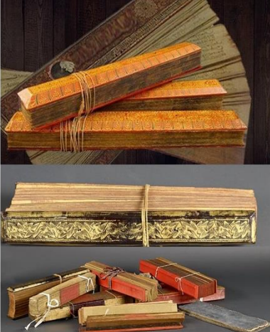
ඡායාරූපය 03 - ඓතිහාසික තොරතුරු සම්පාදනයට යොදාගත් පුස්තකාල පොත්

සිහළුවිධිකතාවේ මෑතකාලීන ඉතිහාසය විචාරාත්මක නොවීමත් කරුණු ගිලිහියාම සහ තොරතුරු ඇතුළත් වීමට බලපෑ හේතු විමසා බැලිය යුතුය. සිහළුවිධිකතාවේ මුල්