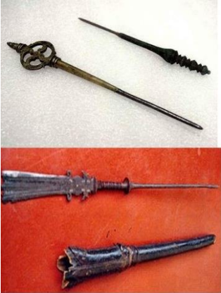
ඡායාරූපය 04 - පුස්කොළ රචනා කිරීමට භාවිතා කළ පන්හිද

මහාපුපය හෙවත් රුවන්වැලිසෑයෙහි ඉතිහාසය දැක්වීමට ලියූ කෘතියක් ලෙස චේතියවංසට්ඨකථාව හඳුනාගත හැකිය. වංසන්ථප්පකාසිනිය මෙම කෘතිය “චේතියවංසට්ඨකථා”, “මහාචේතියවංසට්ඨකථා” යන නම්වලින් හඳුන්වා ඇත. එසේම ක්‍රි. ව. 10 වන සියවසෙන් පසුව ලියවුණු පාලි පුවචංසය ද තමාට පෙර සිංහල භාෂාවෙන් හා පාලි භාෂාවෙන් පැවති කෘතීන් පිළිබඳ සඳහන් කර තිබේ. මීට අමතරව දැනට විද්‍යාමාන නොවන කෘති රාශියක් පිළිබඳ වංසන්ථප්පකාසිනිය ඔස්සේ කරුණු විමසිය හැකිය. සහස්සවත්ථු අට්ඨකථාව, දීපවංසට්ඨකථාව, චූලසීහනාද සුත්‍ර වර්ණා සිංහල අටුවාව, ගණ්ඨිපදන්ථවර්ණනාව සහ සීමාකථාව වැනි කෘතීන් ඒ අතර වෙයි. (Vamsatthapakasini, 1935) මේවායින් විවිධ තොරතුරු වංසන්ථප්පකාසිනිය උපුටා දක්වන බැවින් මෙම කෘතීන් ශ්‍රී ලංකාවේ මුල්ම ඓතිහාසික සම්පාදන අවස්ථාවන් නියෝජනය කළ බව සිතිය හැකිය. (රත්නසාර හිමි, 2017)